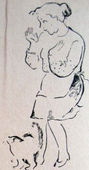
Рис. Л. Котановой