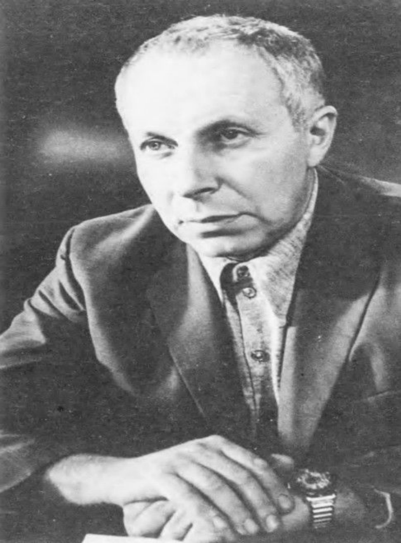
А. П. Межиров (1923-2009)