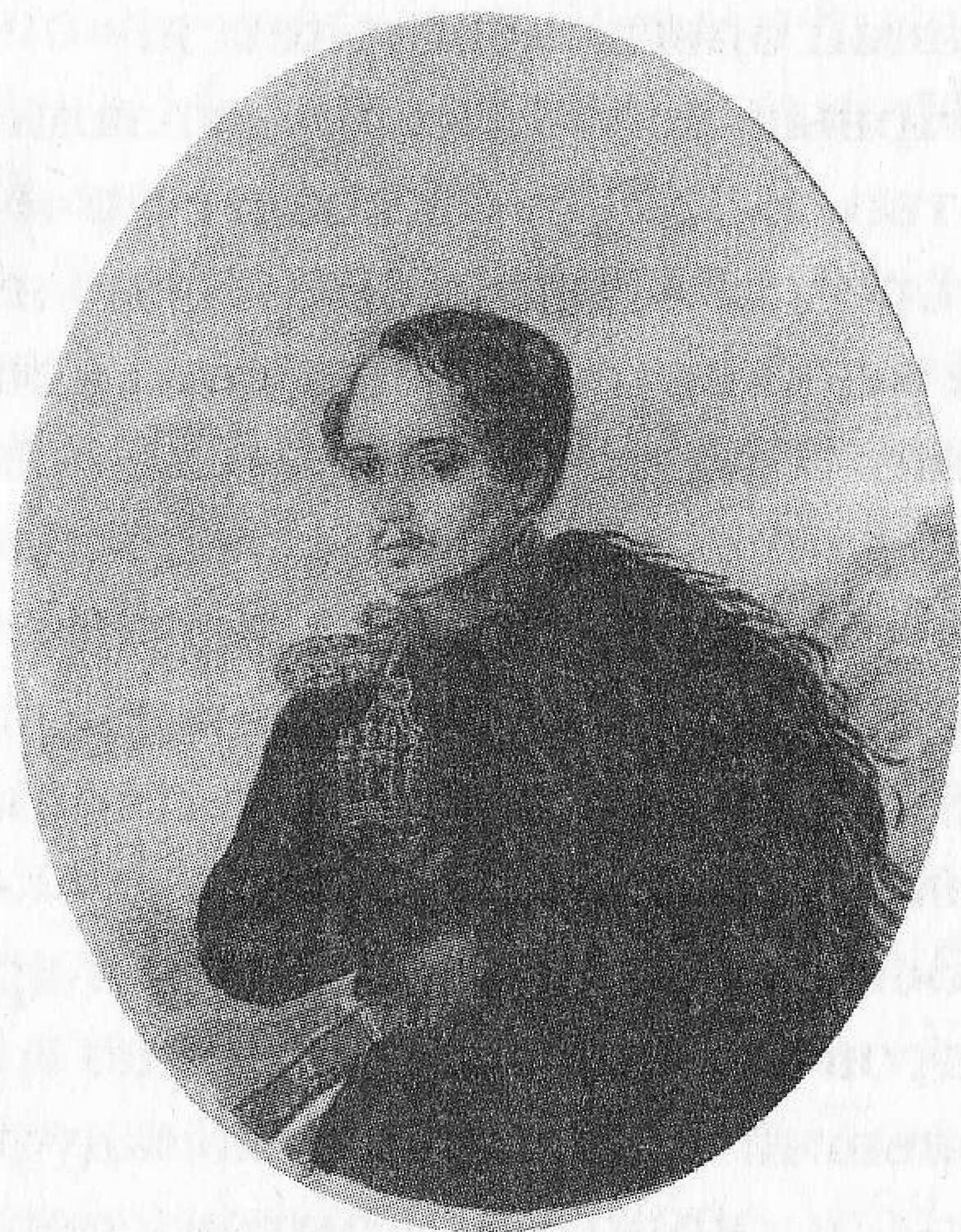
М. Ю. Лермонтов. Автопортрет. 1837 г.

В марте 1837 г. Лермонтов через Москву отправляется в свою первую ссылку на Кавказ, поскольку там воевал его новый полк. В начале мая он приехал в Ставрополь и подал рапорт о болез-