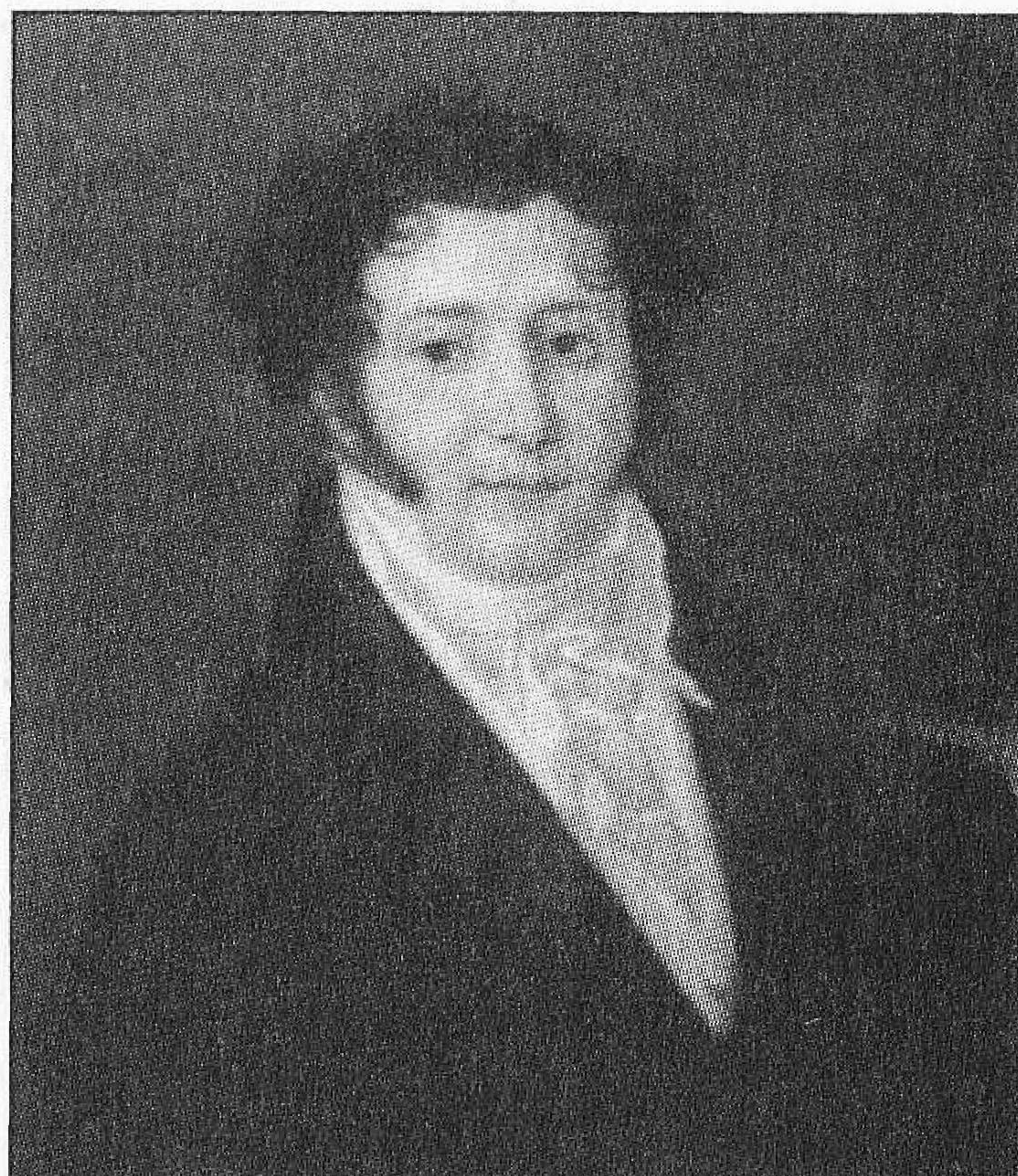
М. М. Лермонтова и Ю. П. Лермонтов. Родители поэта.

ленного рода Стольпиных. Ее брак с мелким помещиком, отставным офицером Юрием Петровичем Лермонтовым не обрадовал родных. Отца Марии Михайловны к тому времени не было в живых, после рождения дочери его отношения с женой Елизаветой Алексеевной расстроились, он увлекся другой женщиной, в 1810 г. покончил с собой. Елизавета Алексеевна не захотела расставаться с единственной дочерью. Юрий Петрович согласился жить в Тарханах, тем более что в небольшом тульском имении кроме него жила еще его мать с незамужними дочерьми. Но брак по любви родителей будущего поэта оказался тоже неудачным. После рождения сына Юрий Петрович заметно охладил к своей мягкой, мечтательной, болезненной жене, что не улучшило отношения к нему тещи. В доме происходили постоянные ссоры, безусловно ускорившие развитие болезни Марии Михайловны, и на двадцать втором году жизни она умерла от чахотки, оставив сиротой сына двух с половиной лет. Тем не менее у Лермонтова осталось воспоминание о матери. В автобиографических заметках читаем: «Когда я был трех лет, то была песня, от которой я плакал: ее не могу теперь вспомнить, но уверен, что если бы услышал ее, она бы произвела прежнее действие. Ее певала мне покойная мать». Музыкальная Мария Михайловна, по свидетельствам домашних, действительно часто брала сына на колени и садилась с ним к фортепьяно.