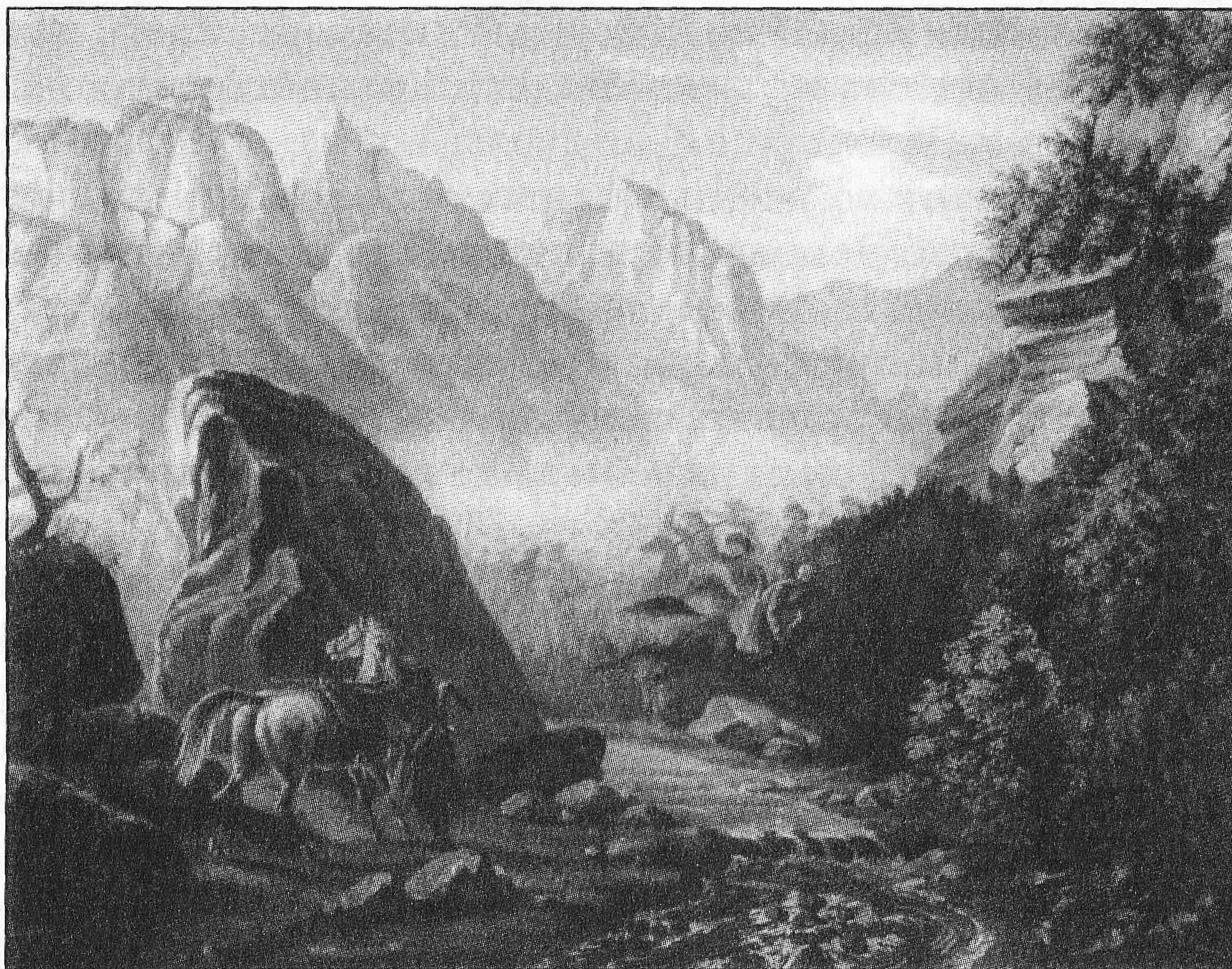
М. Ю. Лермонтов. Перестрелка в горах Дагестана. 1840–1841 гг.

Настойчивые хлопоты бабушки привели к тому, что Николай I разрешает дать Лермонтову двухмесячный отпуск. В начале февраля 1841 г. он приезжает в Петербург. В этот приезд