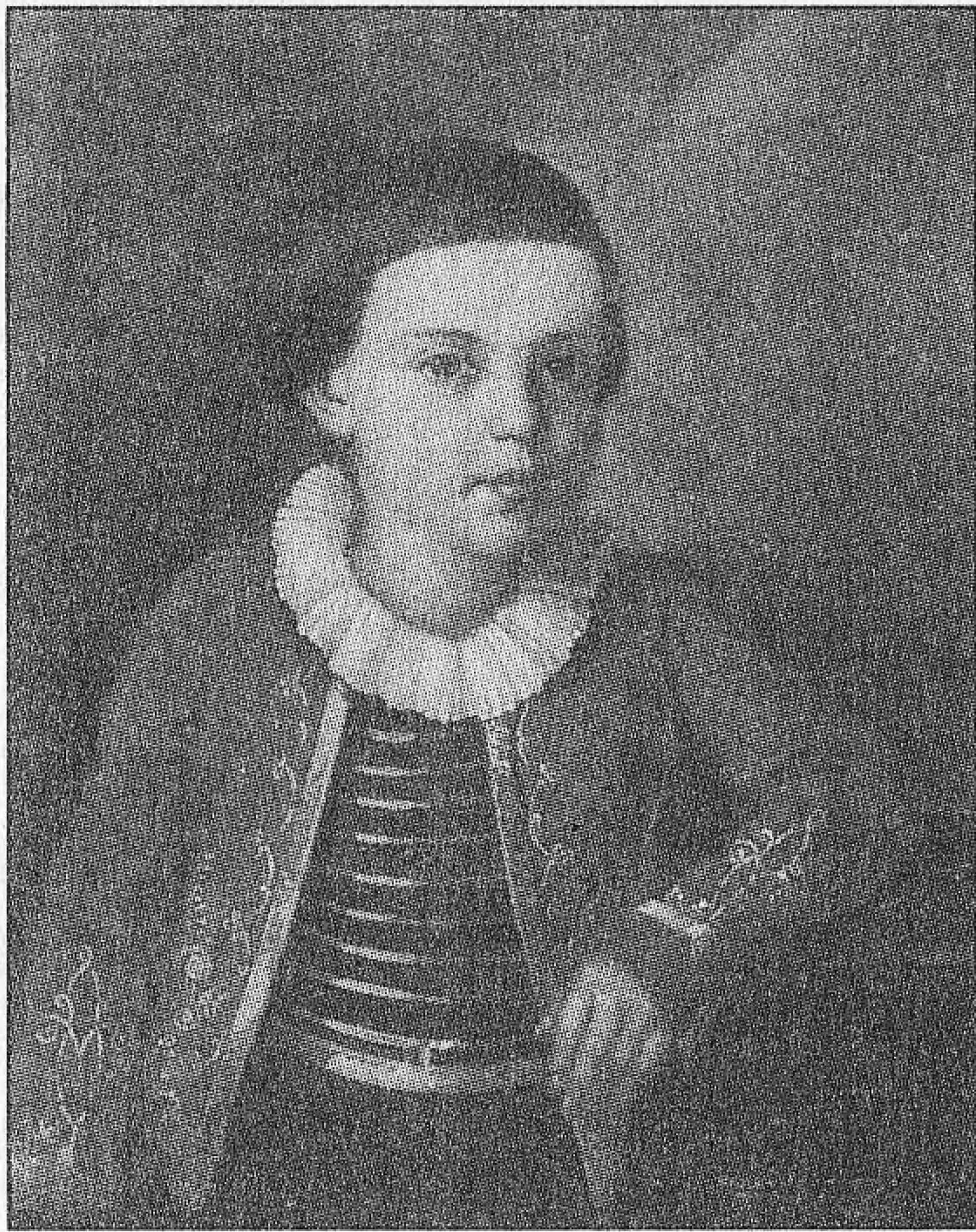
М. Ю. Лермонтов в детстве. 1820–1822 гг.